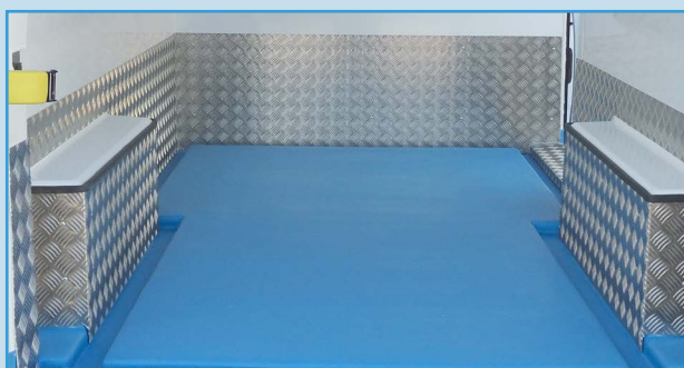
Zócalo de aluminio