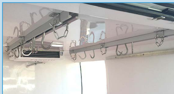
Carriles porta carne